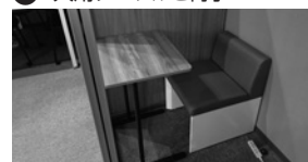
② 1人用テーブルと椅子 × 1