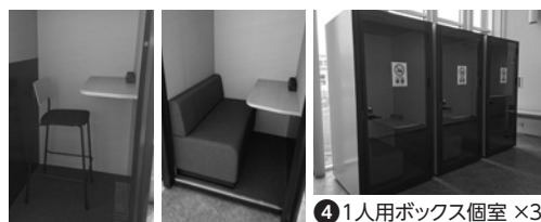
④ 1人用ボックス個室 × 3

市民や企業の方々の仕事をサポートするために、Wi-Fi環境完備の無料テレワークスペースを開設しました! 家や会社とは違う空間で、新しい働き方の形としてテレワークスペースを活用してみませんか?