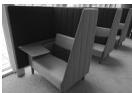
③ 1人用テーブル付ソファ × 3