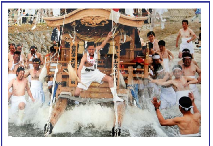
平成25年 福岡県知事賞受賞作品