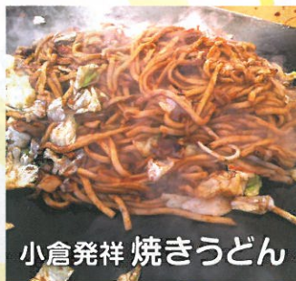
小倉発祥 焼きうどん