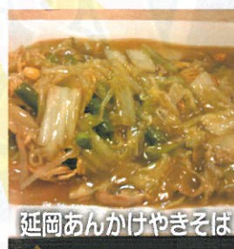
延岡あんかけやきそば