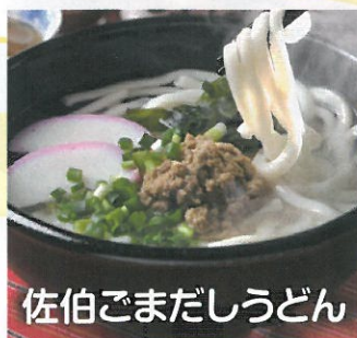
佐伯ごまだしうどん