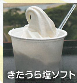
きたうら塩ソフト