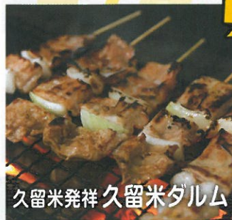
久留米発祥 久留米ダルム